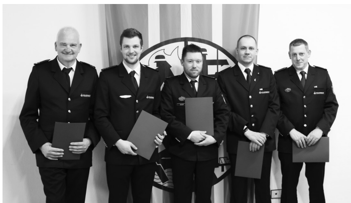
Die anwesenden beförderten Feuerwehrmänner