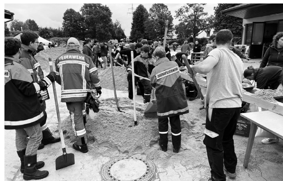
Überlandhilfe der Jugendfeuerwehr in Gundelfingen

Am Montagabend beschloss die Jugendfeuerwehr Hermaringen, sich bereits eine Stunde früher im Feuerwehrhaus einzufinden, um gemeinsam mit ein paar Helfern aus der Einsatzabteilung nach Gundelfingen zur Überlandhilfe zu fahren. Dort halfen sie mit den anderen freiwilligen Helfern 30.000 Sandsäcke für das zu erwartende Hochwasser zu füllen. Dies zeigt, dass man sich in Notlagen, nicht nur auf unsere Einsatzabteilung, sondern auch auf unsere Jugendfeuerwehr verlassen kann.