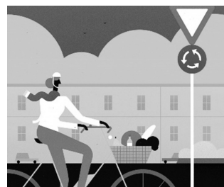
© ADFC „radspaß – sicher e-biken“

Mitzubringen sind ein verkehrstüchtiges E-Bike, eine gefüllte Trinkflasche, ein Fahrradhelm und Kleidung je nach Witterung.