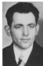
Projektgruppe Georg-Elser-Denkmal Hermaringen