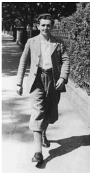
Georg Elser, um 1938

Für die Projektgruppe Georg-Elser-Denkmal Hermaringen Hans-Dieter Diebold